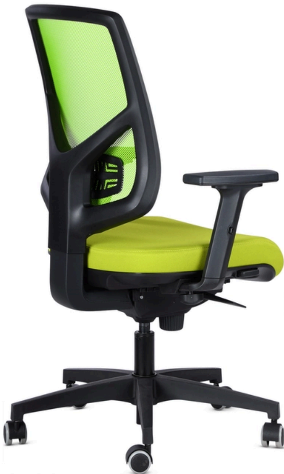
LA PHOTO PEUT INCLURE OPTIONAL

En considération du poids recommandé par ITALIAN SEDIOLITI. Pour les conditions de garantie, veuillez consulter les conditions générales de vente au commencement du listage.